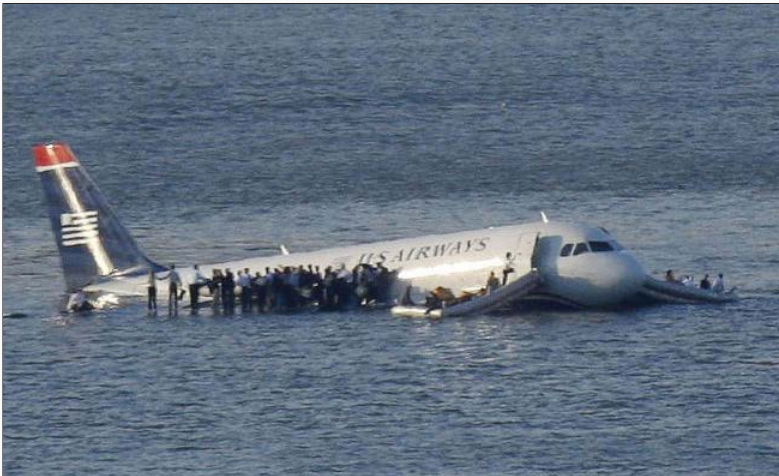
MIRAKULØST: Chesley «Sully» Sullenberger III klarte å redde 155 passasjerer ved å nødlande flyet i Hudson River.

På lydopptaket hører man piloten Chesley «Sully» Sullenberger rolig fortelle tårnet på La Guardia at han har truffet en fugleflokk .